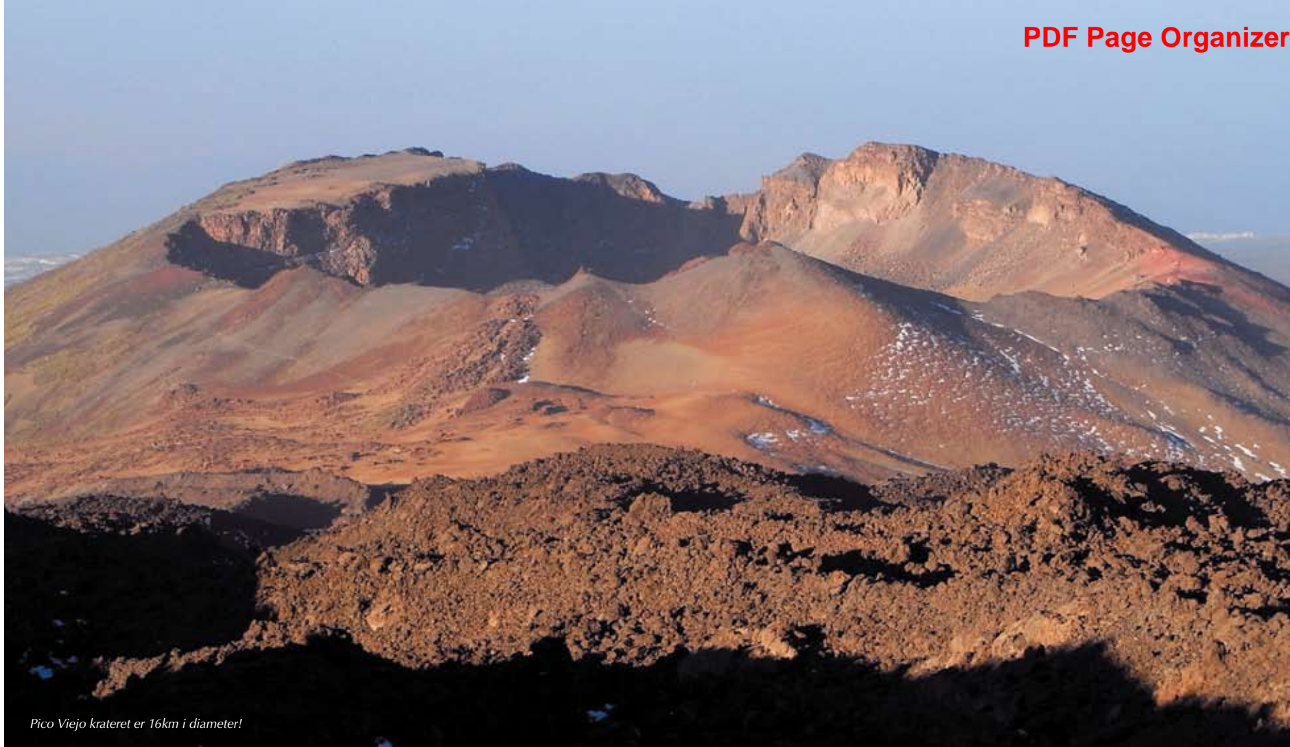
Pico Viejo krateret er 16km i diameter!

Jeg havde på forhånd opgivet at overtale min ni måneder gamle datter og hendes mor til at klatre med op og se solopgang, og forberedte mig derfor på en solobestigning.