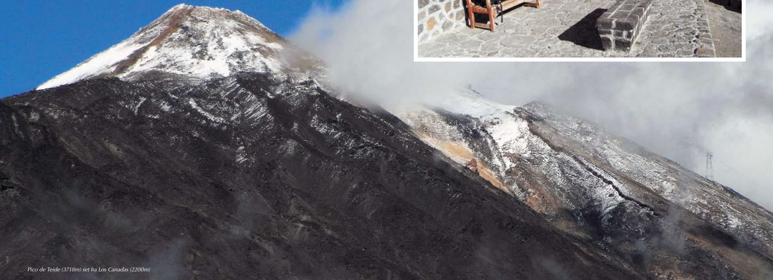
Pico de Teide (3718m) set fra Los Canadas (2200m)